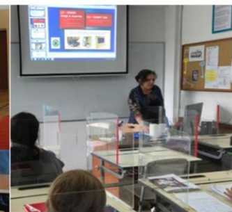
Figure 2 Multiplier event in Romania