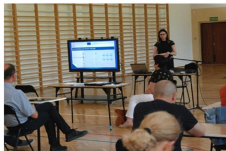
Figure 1 Validation activities in Poland