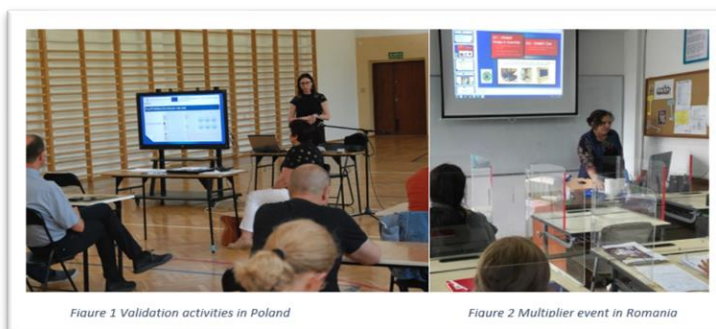
Figure 1 Validation activities in Poland