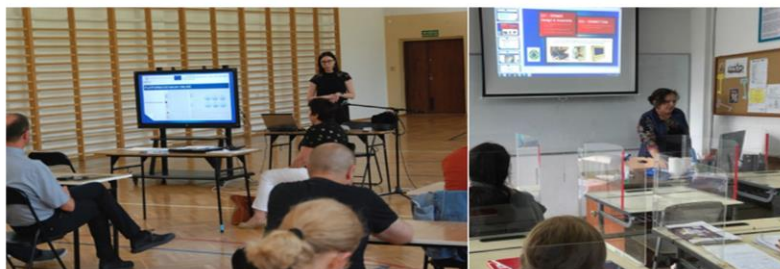
Figure 1 Validation activities in Poland