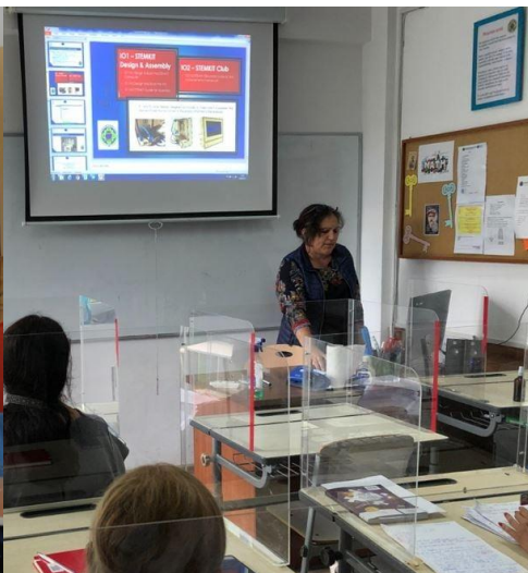
Σχήμα 2 Εκδήλωση προώθησης στη Ρουμανία