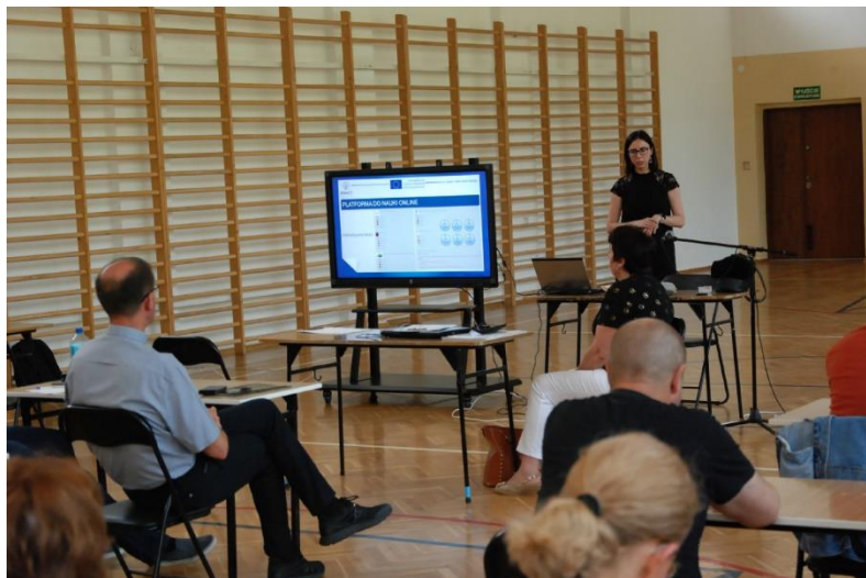
Σχήμα 1 Δραστηριότητες επικύρωσης στην Πολωνία